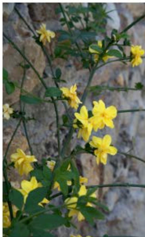
SOIGUL: Det blomstrer og gror i hver eneste krok av hagen. Her er en gul sjasmin som klatrer oppetter muren.

De har også satt opp 14 solpaneler for å være selvforsynte med strøm. Strømmen de ikke bruker, blir solgt videre til kraftselskapet.