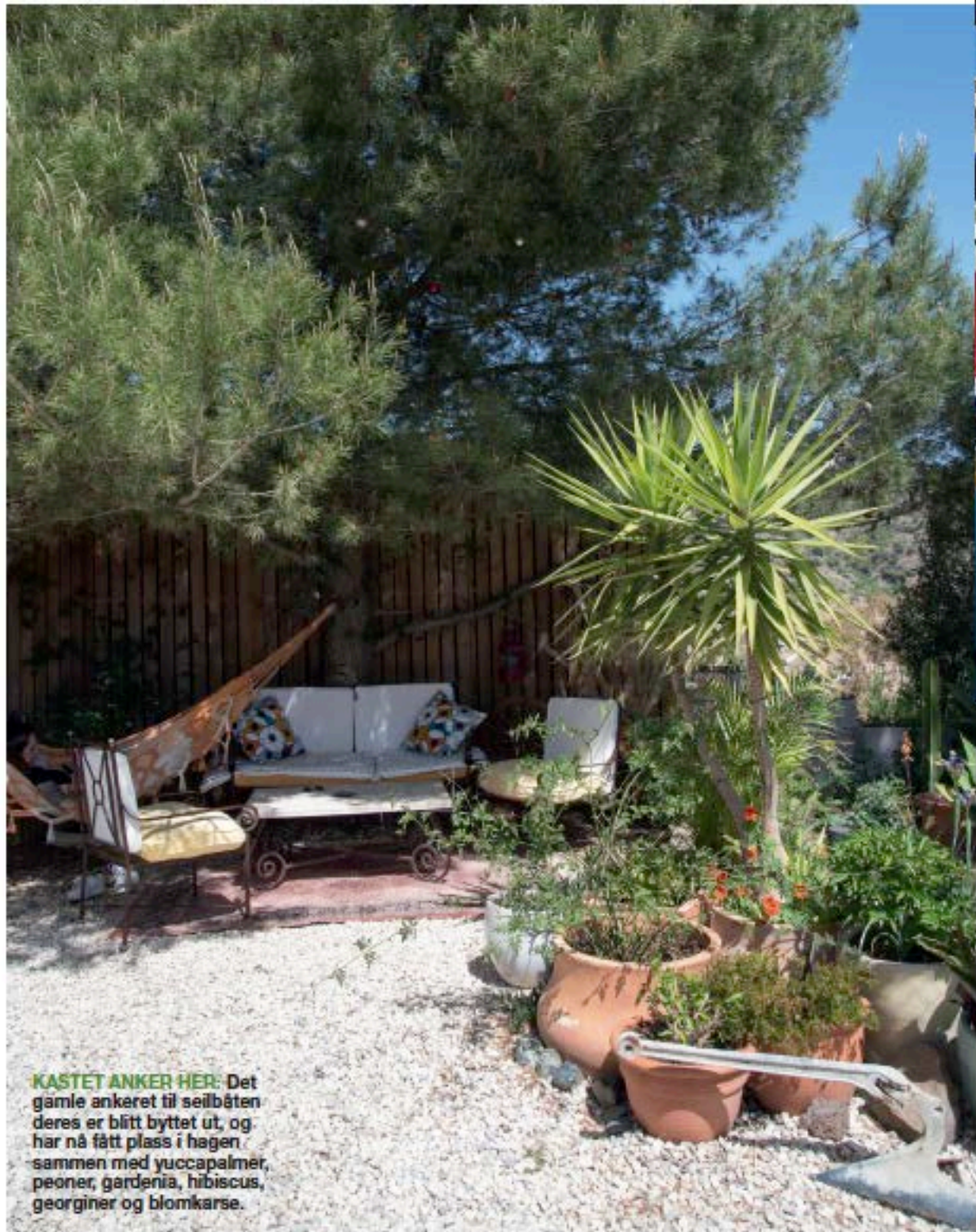
KASTET ANKER HER: Det gamle ankeret til seilbåten deres er blitt byttet ut, og har nå fått plass i hagen sammen med yuccapalmer, peoner, gardenia, hibiscus, georginer og blomkarse.