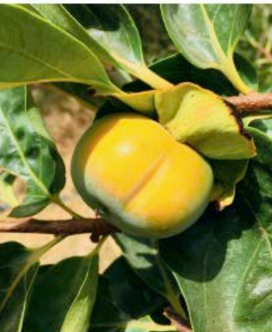
EKSOTISK: Persimon kan ha både oransje og gule frukter.