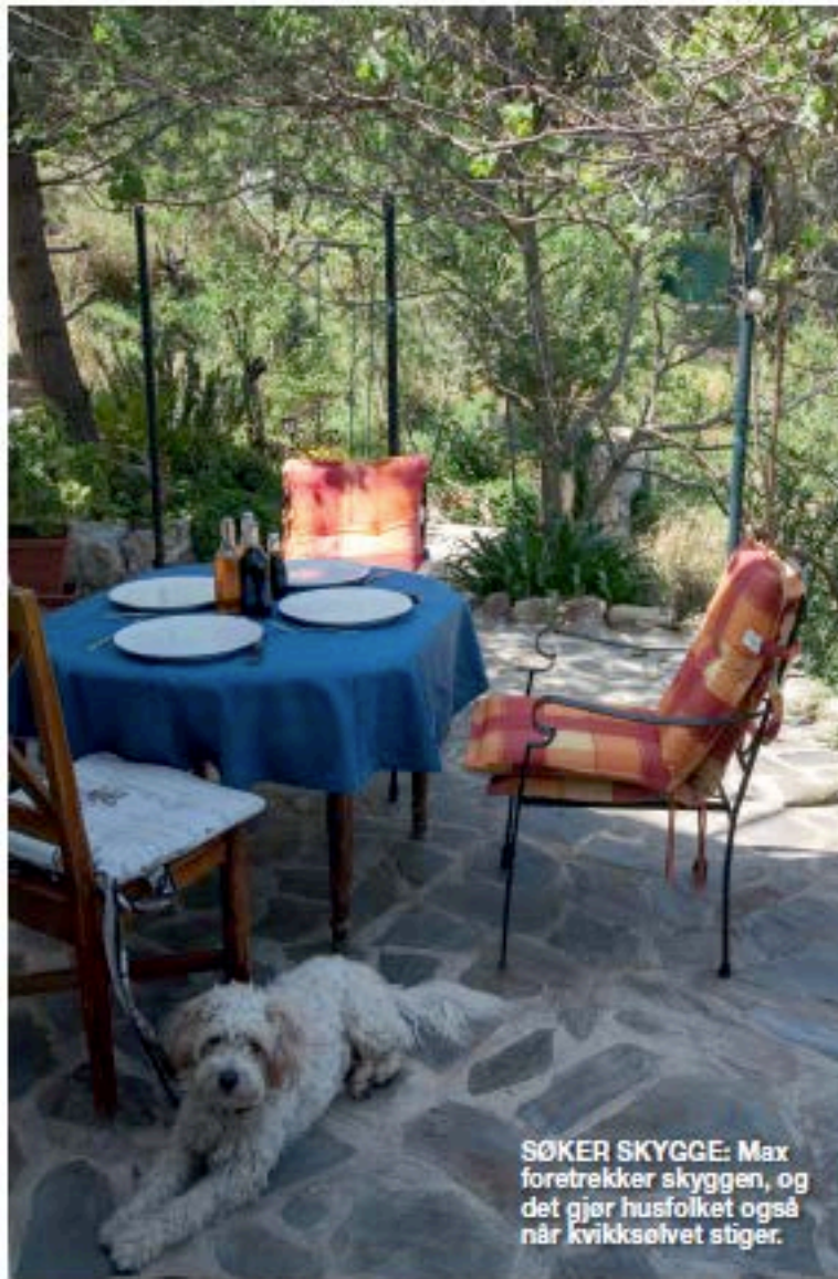
SØKER SKYGGE: Max foretrekker skyggen, og det gjør husfolket også når kvikksølvet stiger.

Siden har de bygd vinterhage, tregerder som beskytter mot vinden og steinmurer med stein håndplukket fra området. De har fått den tørre skråningen med skrinn jord til å bli en grønn oase. De har boret en 150 meter dyp brønn slik at de har sitt eget vann til vanning.