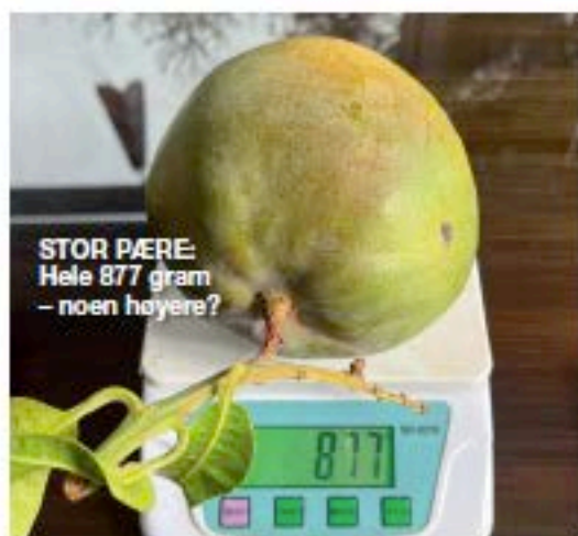
STOR PÆRE: Hele 877 gram – noen høyere?

TEKST: IRENE JACOBSEN